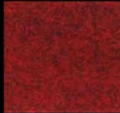
1702 Dark Red