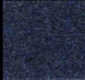
1704 Night Blue