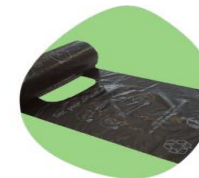
Sacs Gants Réf :1202E Carton de 20 Rouleaux de 200 sacs