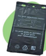
Sacs gants Réf :1222/2500 Carton de 2500 sacs