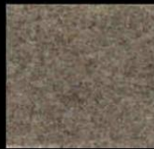
1706 Dark Beige