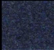
1704 Night Blue