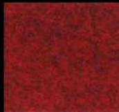
1702 Dark Red